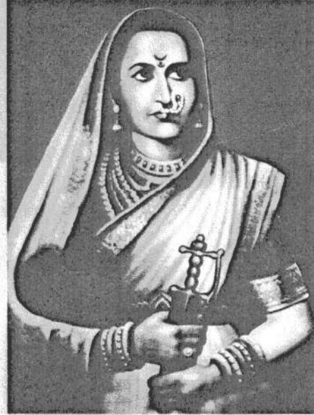
राष्ट्रमाता जिजाऊ माँ साहेब